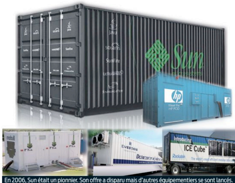
En 2006, Sun était un pionnier. Son offre a disparu mais d'autres équipementiers se sont lancés.

Un parc vieillissant à déménager ou à reconstruire Désormais, les containers maritimes recyclés embarquent des centaines d'équipements d'infrastructure informatique, depuis les serveurs jusqu'aux matériels de détection d'incendie, les alarmes et le contrôle d'accès, en passant par le stockage et les équipements réseau. Sun et Rackable (SGI aujourd'hui) ont été des pionniers dans le domaine. Si, depuis le rachat par Oracle, l'offre Modular Datacenter de Sun n'existe plus, les offres commerciales se multiplient depuis quelques mois : HP, Colt ou encore Bull ont suivi, et proposent leurs datacenters containers ou modulaires, chacun avec des spécificités. Ce tout jeune marché a été rejoint en ce milieu d'année par