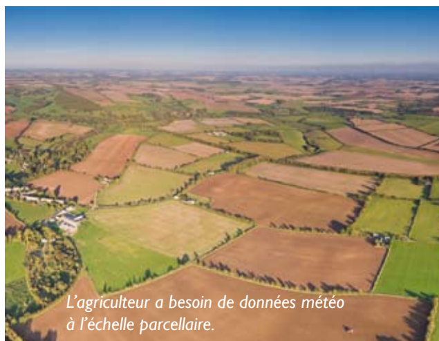
L'agriculteur a besoin de données météo à l'échelle parcellaire.

Pour anticiper les événements climatiques et agir en conséquence, le baromètre ou les appareils similaires ne sont plus aujourd'hui les outils adaptés. La seule voie est d'utiliser les prévisions météo délivrées par des sociétés spécialisées qui, pour les générer, mettent en oeuvre des modèles mathématiques simulant les conditions atmosphériques. Aujourd'hui elles ne peuvent être établies sérieusement qu'à une échéance de 3 à 5 jours maximum. Avec