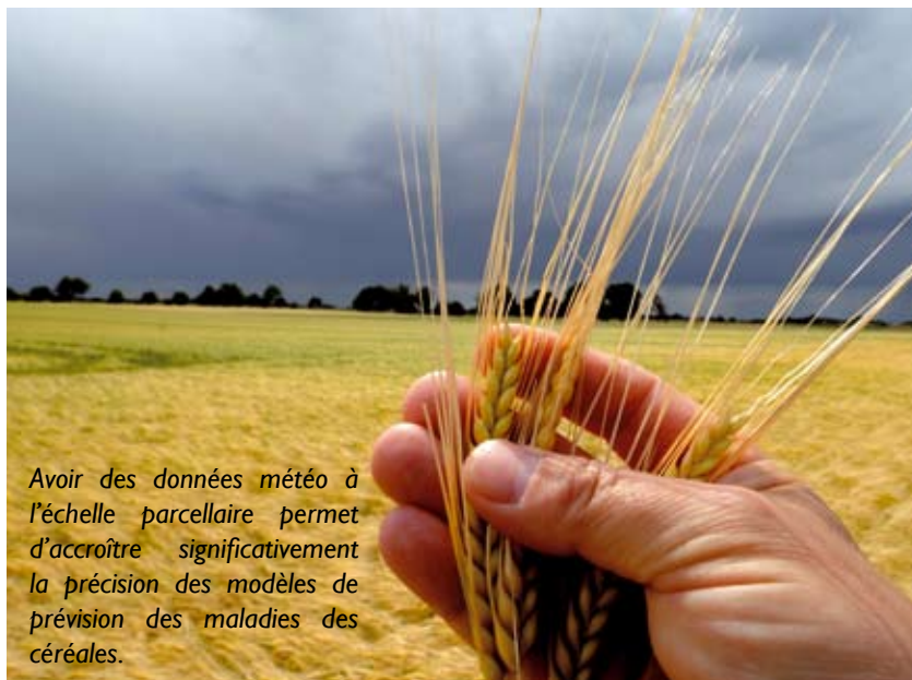
Avoir des données météo à l'échelle parcellaire permet d'accroître significativement la précision des modèles de prévision des maladies des céréales.

L'appréciation donnée prend en compte les aspects qualité et coût de l'information. En effet, les outils les mieux adaptés en matière de météorologie resteront les capteurs météo et les prévisionnistes météo mais avec des coûts qui ne sont pas à la portée de tous les domaines d'activité. La Station Météo Virtuelle est aujourd'hui l'outil dont le rapport qualité/prix est le plus adapté aux besoins de la plupart des acteurs agricoles dont le risque climatique doit être évalué le plus précisément possible sur de larges territoires.