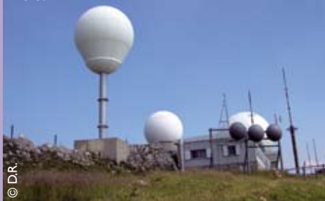
Radars météorologiques sur le sommet de la Dole.

Les radars classiques de Météo France contribuent déjà aujourd'hui à fournir de l'information quantitative sur la pluie au travers le